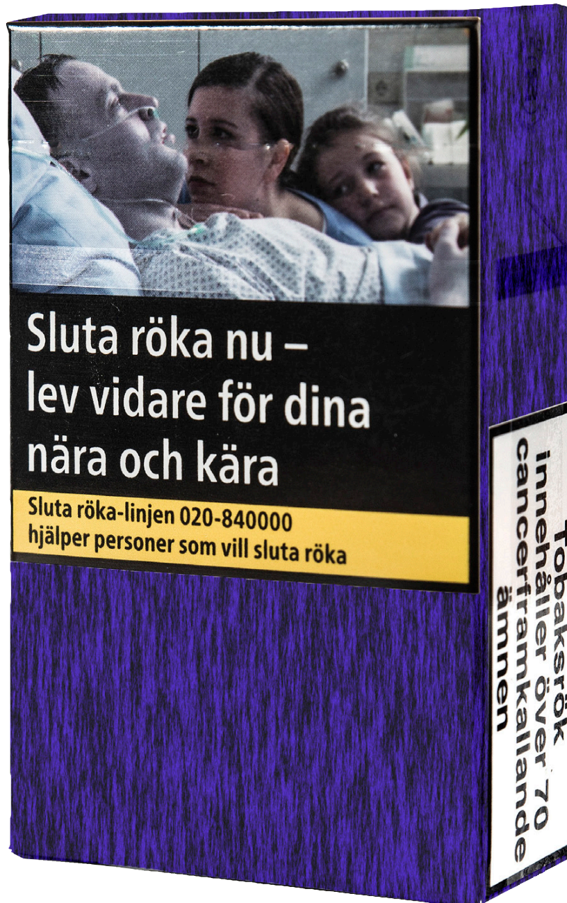
Ny förpackning som upplyser om att cigaretterna innehåller cancerframkallande ämnen.