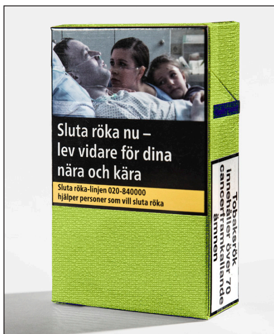
Förpackning enligt nya regler som genomfördes i Sverige den 20 maj 2016 (logotyper bortretuscherade).

Direktivet innebär även ett förbud mot att ange halterna av tjära, nikotin och kolmonoxid på förpackningar med tobaksvaror. Förbudet har införts för att tobaksbolagens uppgifter varit gravt missvisande och fått konsumenter att tro att vissa cigaretter, s.k. light-cigaretter, är mindre skadliga än andra cigaretter.